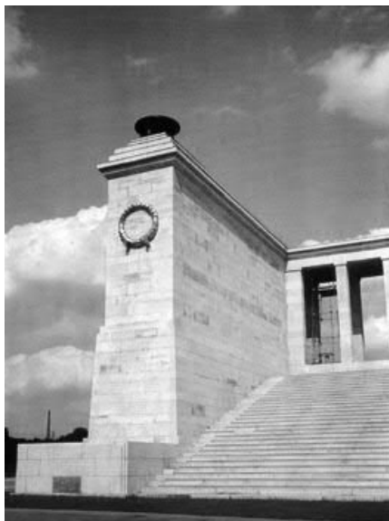
Das Schwarz-Weiß-Motiv Nr. 5 der Klappkarte (ab 1937)

REKONQUISTA • Presse • Galerie • Verlag Michael Sabadi Wetzendorfer Straße 242 D-90427 Nürnberg