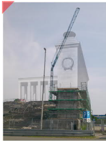
Identischer Blickwinkel 2016