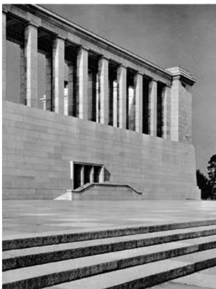
Schwarz-Weiß-Motiv 4 (ab 1937) | © Rekonquista