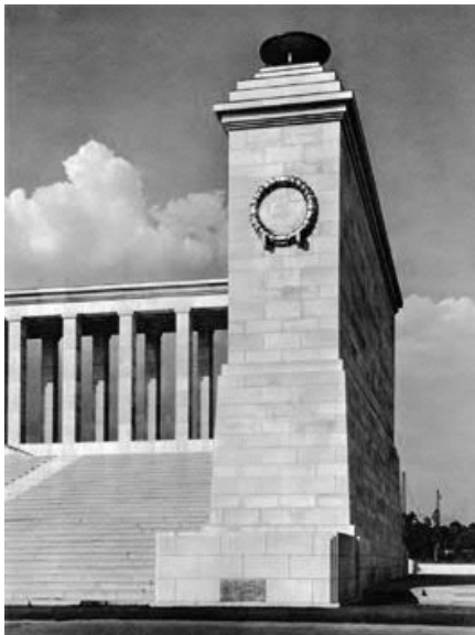
Schwarz-Weiß-Motiv 2 (ab 1937)