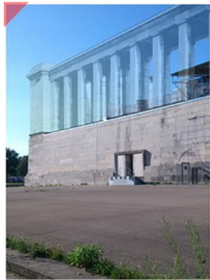
Identischer Blickwinkel 2016