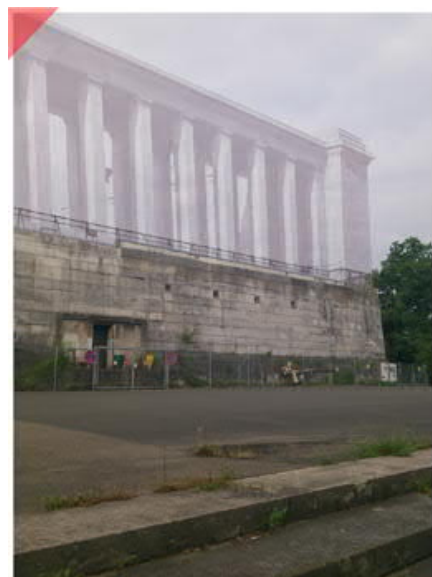
Identischer Blickwinkel 2016