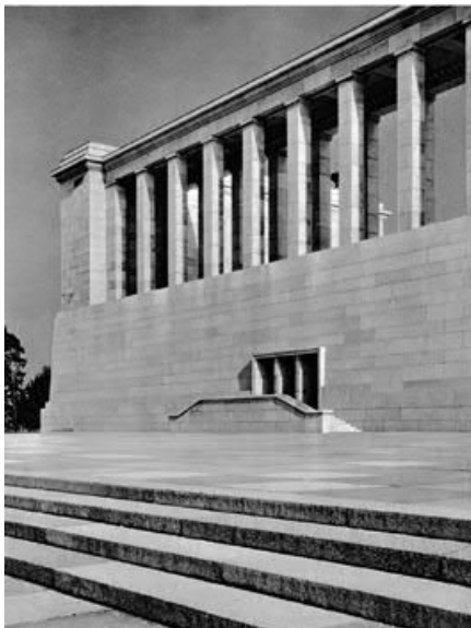
Schwarz-Weiß-Motiv 3 (ab 1937) | © Rekonquista