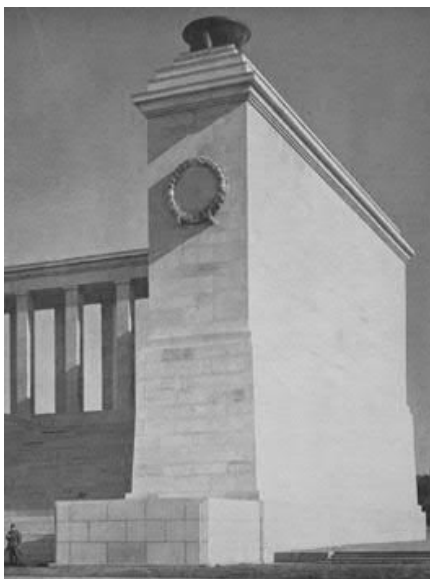
Schwarz-Weiß-Motiv 1 (ab 1937)