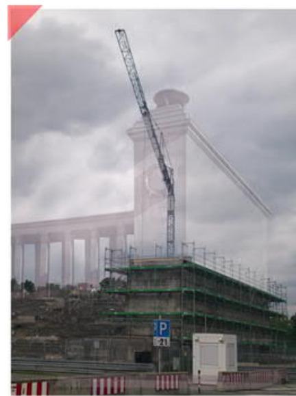
Identischer Blickwinkel 2016