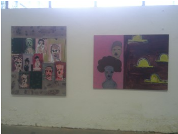
Thomas Egerer © Rekonquista