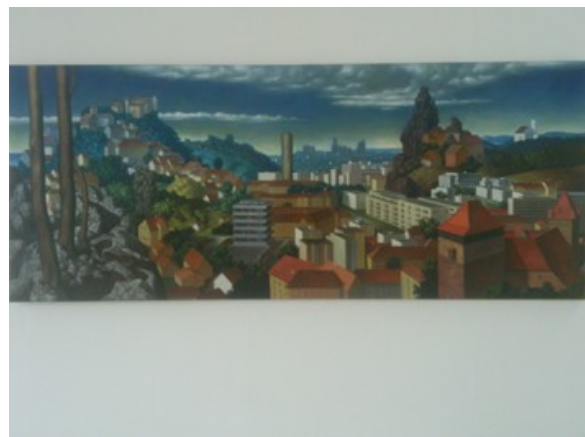
Jürgen Weiß © Rekonquista

Skulpturen aus Granit, Holz, Kunststein und Gips: