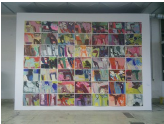
Christine Nikol © Rekonquista

Großflächige Arbeit – sauber gearbeitetes Acryl-Gemälde: