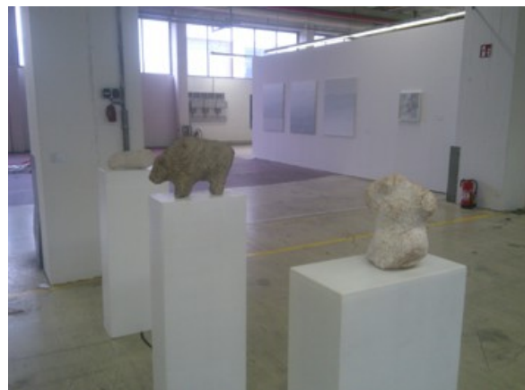
Archaische Figuren © Rekonquista

Zur „WERKSCHAU“ gehören immer auch Werke, die qualitativ etwas aus dem Rahmen fallen. Eine Auswahl (Kunststoff-Jalousien, bronzefarbener Folie, Acryl-Schmiererei und Kunstmarkt-Anbiederung):