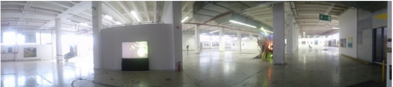
Blick in die Ausstellung „Werkschau 2015“

Große Qualitätsschwankungen zeichnen auch dieses Jahr wieder die Gemeinschaftsausstellung der Künstler „Auf AEG“ in Halle 15 aus. Die versammelten Maler, Bildhauer, Grafiker und Designer zeigen handwerklich sauber gearbeitete Bilder – aber auch farblich grelle Werke auf Photoshop-Basis.