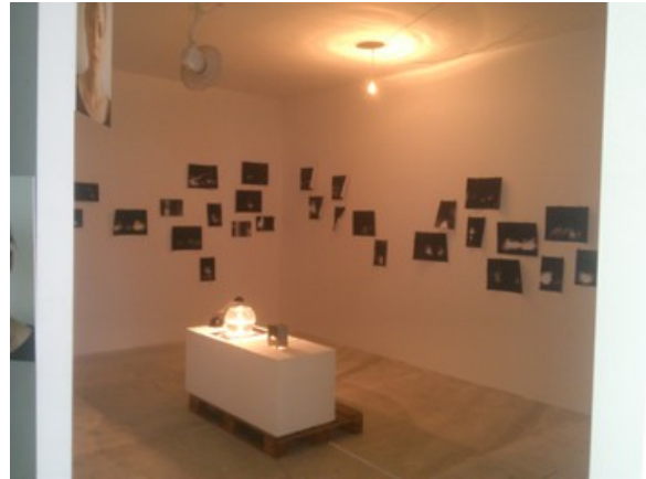
Dunbar & Frischmann © Rekonquista

Großflächige Arbeit – sauber gearbeitetes Acryl-Gemälde: