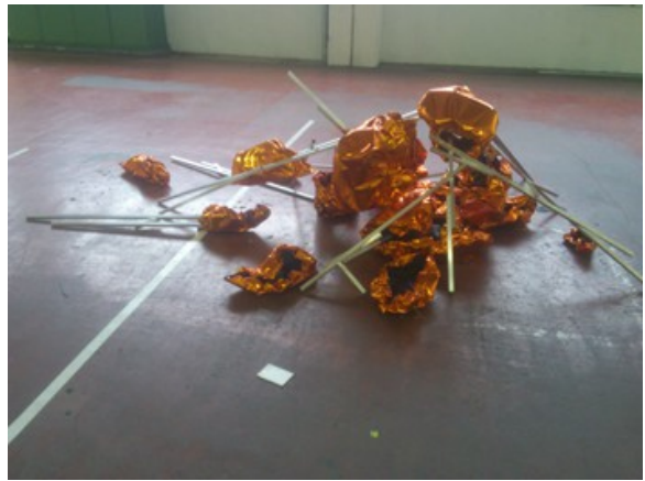
Jeff Koons-Anbiederung