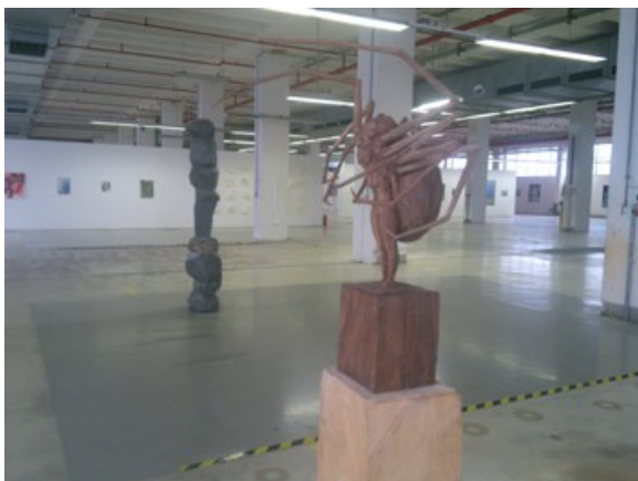
Ruckdeschel (I.) und Rösner

Skulpturen aus Granit, Holz, Kunststein und Gips: