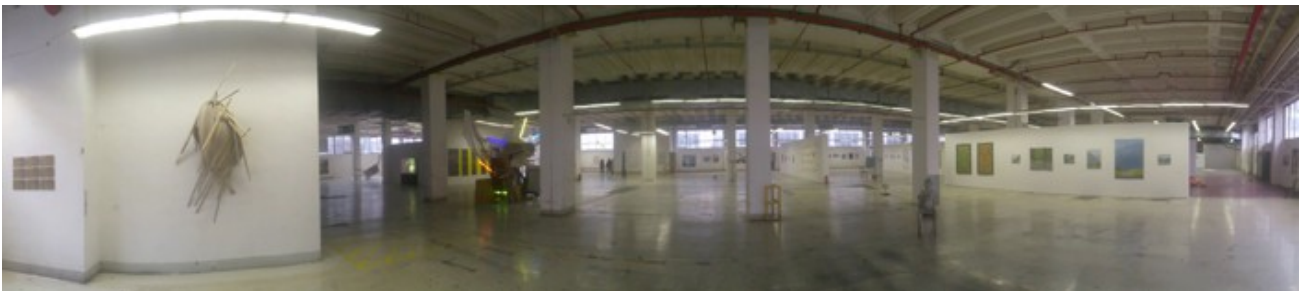
Zweiter Blick in die Ausstellung „Werkschau 2015“